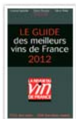
Cité dans : le guide de la Revue des Vins de France 2012

Apéritif - à la place d'un dessert- pour plaisir à tout moment